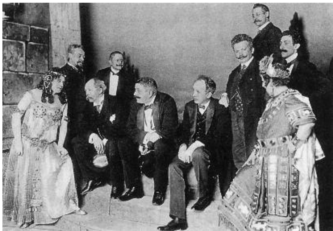
Un momento della prove di Salome a Dresda nel 1905 (Milano, raccolta Lesnig). Richard Strauss è il primo a destra dei tre uomini seduti.