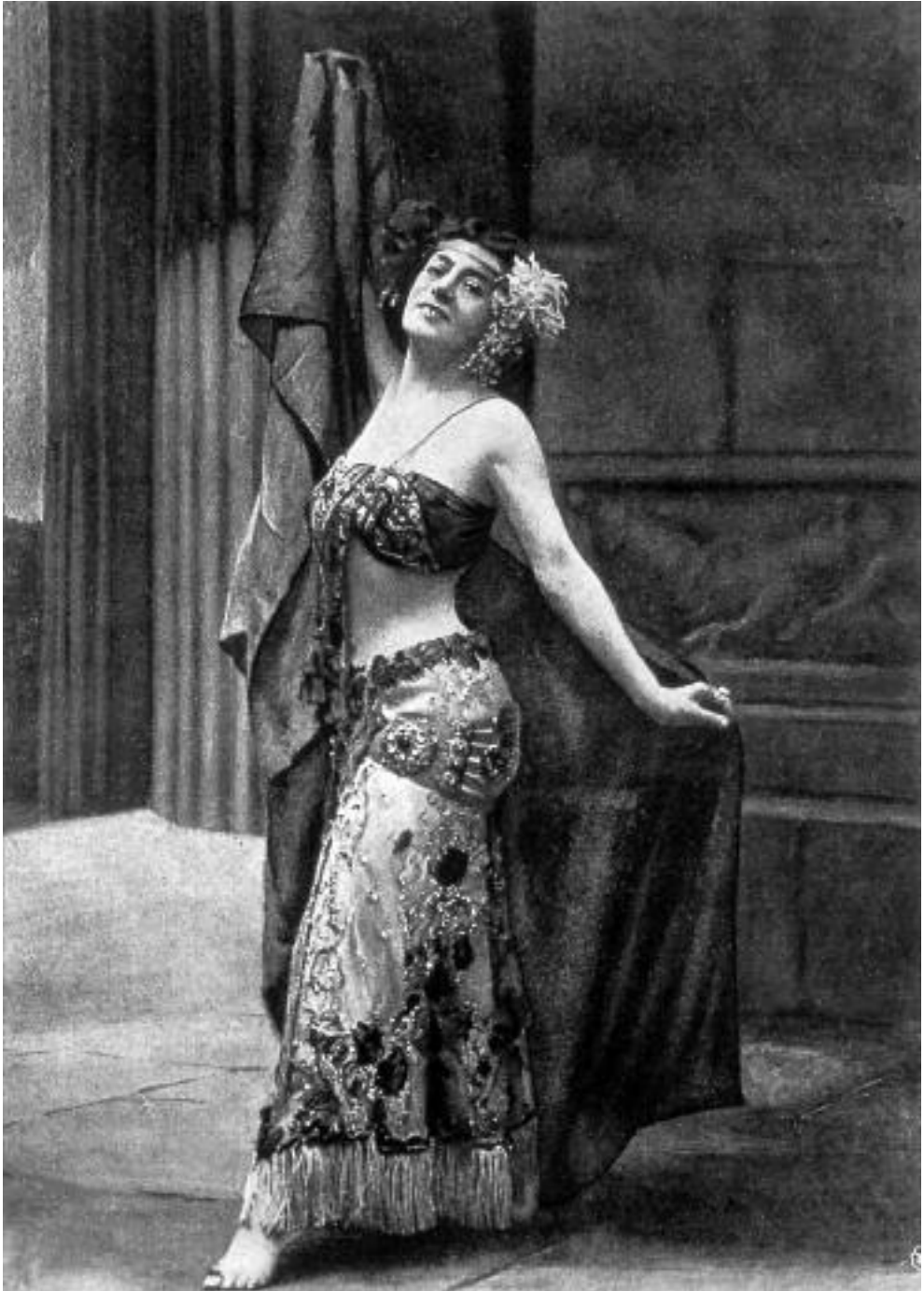
Gemma Bellincioni, interprete di Salome a Torino alla prima italiana dell'opera nel 1906.