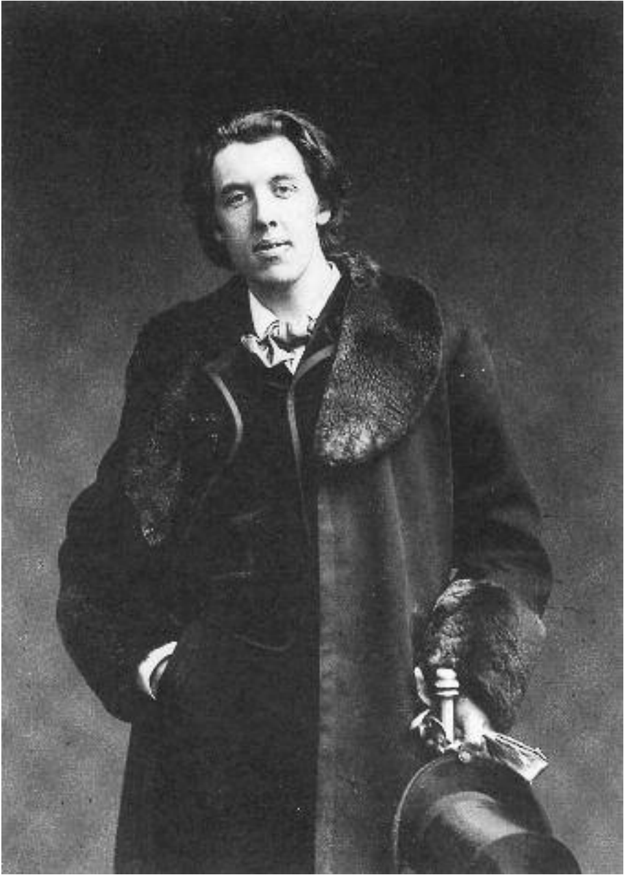
Un ritratto fotografico di Oscar Wilde durante il viaggio dello scrittore in America nel 1881.